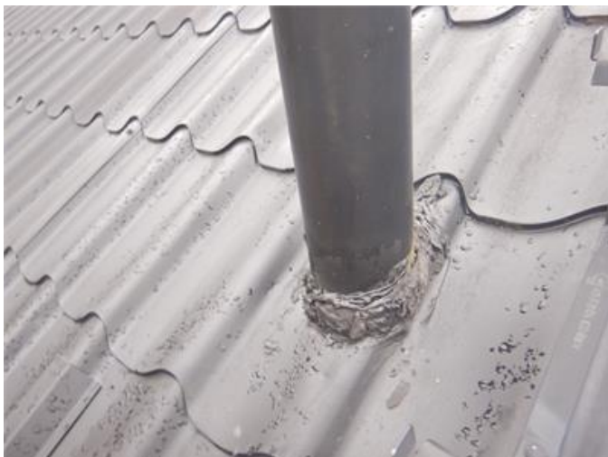
Genomföring i yttertak