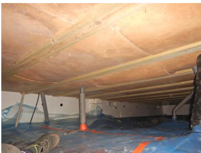
Påväxt på undersida av bjälklag