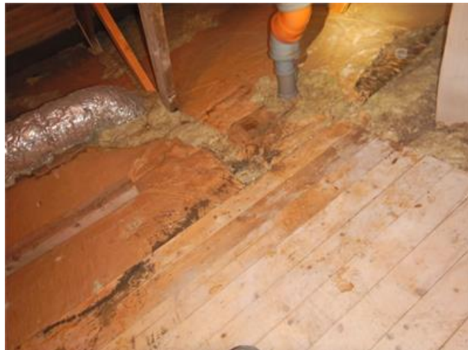
Missfärgning på isolering efter tidigare fuktpåverkan.