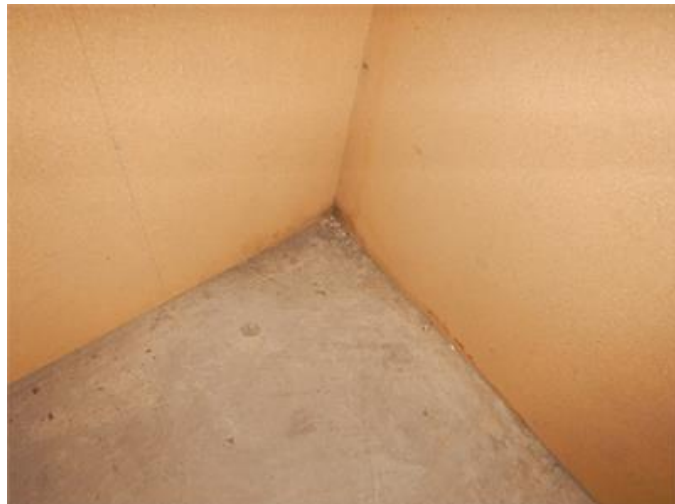
Missfärgning på väggskiva ytterhörn i garage