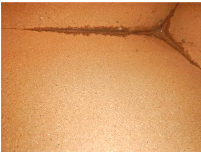
Missfärgning i tak i garage