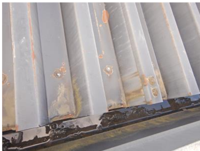
Infästning i takplåt med skruv /spik